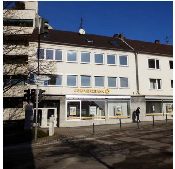
So sah der Baukörper vor dem Umbau aus.

Dachdeckung: RHEINZINK prePATINA blaugrau in Doppelstehfalz- und Winkelstehfalztechnik sowie für die Dachentwässerung, Strukturmatte RHEINZINK AIR-Z, Falzdichtungsbänder