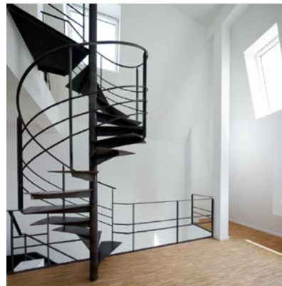
Die unregelmäßige Fensteranordnung sorgt in den Maisonette-Wohnungen der Aufstockung für überraschende Raumeindrücke. Der winterliche Wärmeschutz auf den Sparren sowie eine zusätzliche Zwischensparrendämmung für den sommerlichen Wärmeschutz stellen ein behagliches Wohnklima sicher.