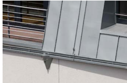
Wassereinlauf an der Straßenseite, der an ein innen liegendes Fallrohr angeschlossen und mit einem optisch sehr dezenten Wasserspeier ausgerüstet ist.

Die Aufsparrendämmung stellt den winterlichen Wärmeschutz komplett sicher, trotzdem erhielten einige Dachflächen zusätzlich eine Dämmung aus eingeblasenen Zelluloseflocken zwischen den Sparren. Sie erhöht durch ihre Masse den Schallschutz, vor allem aber reduziert sie auf südlich orientierten Teilflächen die Wärmewirkung der Sonnenstrahlung: Hitzespitzen werden gekappt (Amplitudendämpfung) und der Hitzedurchgang verzögert (Phasenverschiebung). Die Bewohner der durch die