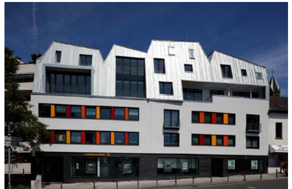
Dachlinie als Blickfang: Die massiven Untergeschosse aus den 1950er Jahren erhielten eine Aufstockung in Holzleichtbauweise mit markant geformtem Titanzinkdach.