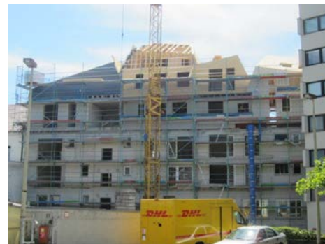
Um möglichst wenig zusätzliche Masse einzubringen, wurden die neuen Geschosse komplett im Holzleichtbau und mit einer Deckung aus Titanzink ausgeführt.