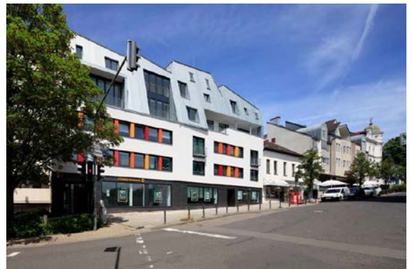
Die neue Dachlandschaft gibt der Häuserzeile einen kontrastreichen Abschluss, setzt sie aber mit ihrer bewegten Form zugleich auch fort.